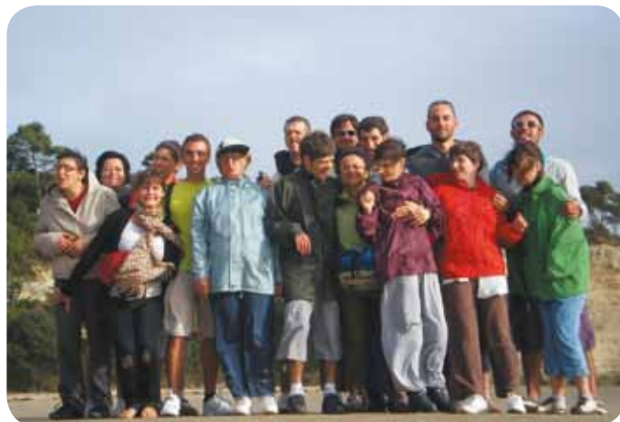
L'équipe de la Forêt en séjour à St Fort sur Gironde (16) du 5 au 9 septembre.

5 Septembre 2011, rentrée scolaire pour tous !