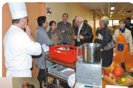
Des recettes originales élaborées par l'UCR pour la semaine du goût aux Halles De Dax le 22 octobre