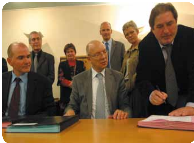
Signature des conventions entre les deux établissements landais