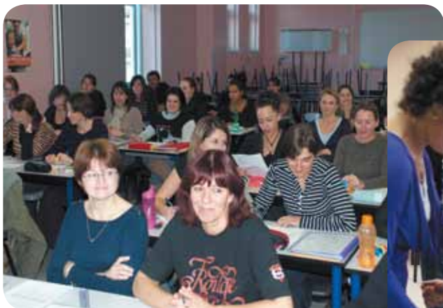
Premières impressions des élèves aides-soignants