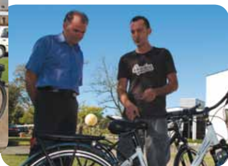
La journée de la mobilité a fait se déplacer les directeurs...