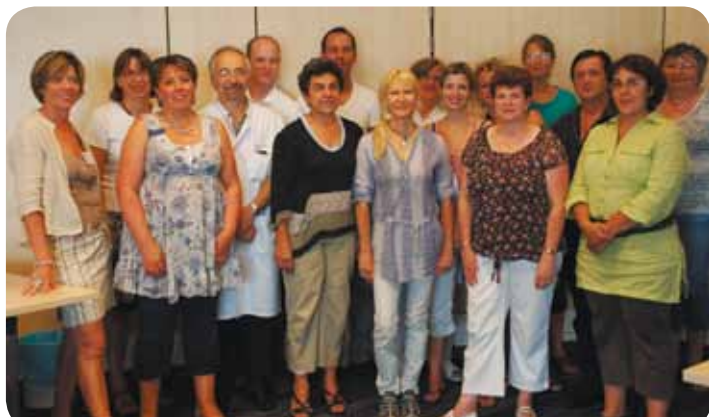
De gauche à droite

Conformément au décret n° 2010-449 du 30 avril 2010, le Centre Hospitalier de Dax a procédé aux élections de la commission des soins infirmiers, de rééducation et médico-techniques.