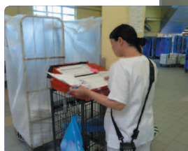
Distribution 78 points de distribution (50 intra hospitaliers et 28 extérieurs)