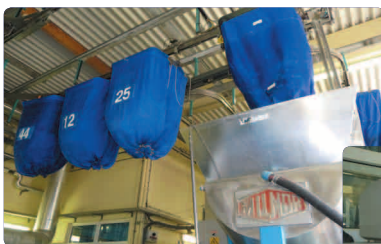
Ordonnancement 1 tunnel = 1 tonne par heure 2 machines de 60 kg