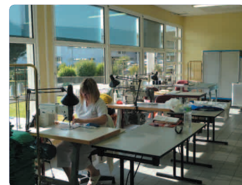
Couture raccourcissement du linge des pensionnaires

2 machines aseptiques Dubix® 60 et 60 kg 2 séchoirs 20 et 40 kg 1 table à détacher Volume traité entre 300 et 400 kg/jour