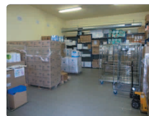
Usage unique distribution dans 19 UF du court séjour et 12 UF de gériatrie