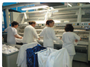
Petit plat 5000 pièces par jour (taies, serviettes, torchons, nappes...) 1 sécheuse-repasseuse Jensen® petit plat: 220 000 torchons, 570 000 serviettes de table,...