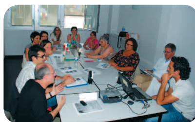
Formation Soins Palliatifs en UNV les 26 et 27 mai