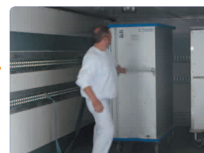
Livraison 72 211 km en 2010 4 véhicules assurent collectes et livraisons

À l'hôpital, le linge est au plus près du malade, à son contact direct. C'est un élément de confort indispensable et un des points névralgiques d'un service de soins.