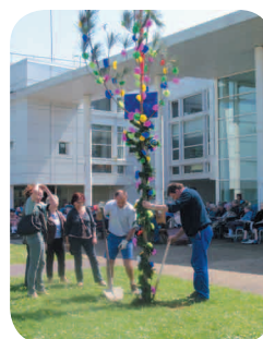
L'association "l'Esquipadge" avec son orgue de Barbarie et ses sketches ont animé la Fête des Aînés au centre de Gériatrie ce 29 avril