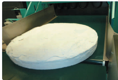
Essorage presse de 10 à 40 bars Galette de 35 à 50 kg 1 cycle toutes les 2 min 30

Nous sommes tous des acteurs de la bonne qualité du linge. Certaines règles comme le lavage et la désinfection des mains participent à la non contamination d'articles propres. Une vigilance visuelle et olfactive des articles lavés permet de veiller à la qualité du linge.