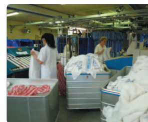
Éponge 2 plieuses éponges 1 500 000 serviettes et draps de bain