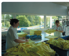
Lavettes / Franges +/- 7000 lavettes par jour +/- 4000 franges par jour