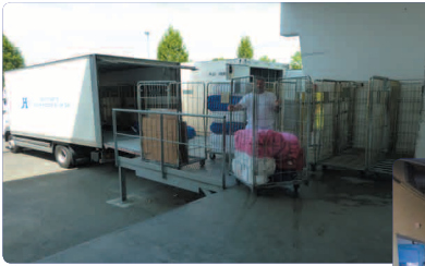
Réception du linge sale de 9 à 14 tonnes par jour

3 215 143 kg de linge lavé Entre 9 et 14 tonnes/jour 34 000 kg lessive/an (Données 2010)