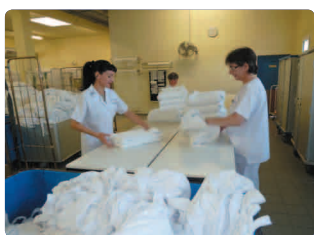
Pliage manuel +/- 1500 peignoirs par jour 255 000 par an