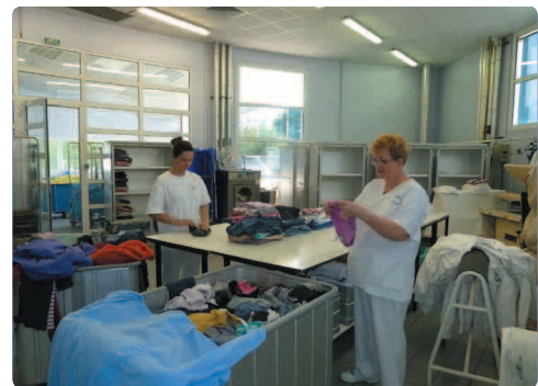
Repassage et tri du linge des pensionnaires +/- 80 800 kg par an (trié par service)