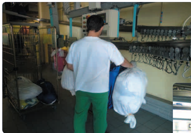
Tri du linge sale 8 stations de tri