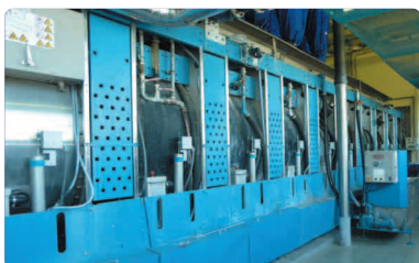
Tunnel de lavage 1 tunnel = 1 tonne par heure 10 modules de 50kg +/- 300 cycles par jour

Aujourd'hui 65 agents assurent, 5 jours sur 7, le traitement du linge de plus de 30 établissements