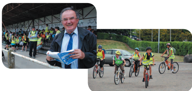
L'hôpital, partenaire de l'action d'éducation à la sécurité routière "Cycliste en liberté" Le 26 mai