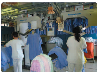
Chemises patients Tenues de travail +/- 3500 par jour

Nous sommes tous des acteurs de la bonne qualité du linge. Certaines règles comme le lavage et la désinfection des mains participent à la non contamination d'articles propres. Une vigilance visuelle et olfactive des articles lavés permet de veiller à la qualité du linge.