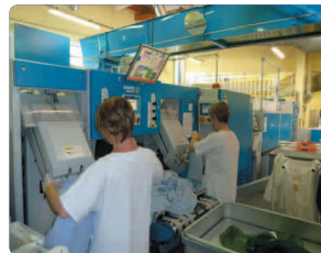
Grand plat +/- 5000 pièces par jour (draps, alèses,...) 1 sécheuse-repasseuse Jensen® grand plat : 870 000 draps/an